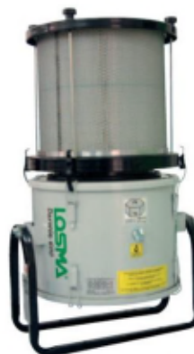
Post-filtre cartouche plissée