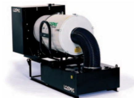
Préfiltre synthétique & métallique